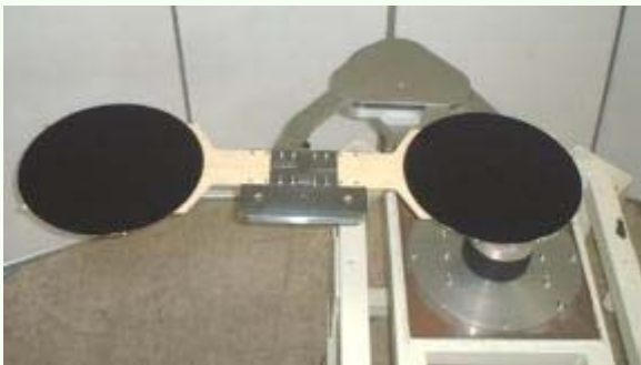
◆ウエハ搬送ロボット