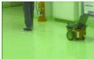
◆移動ロボットの人物追跡

カメラから画像情報をもとに移動ロボットの自律制御を実現してます。必要なセンサはカメラのみですので、システムの構成が簡単になります。