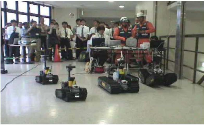
◆複数台レスキューロボットを使った想定訓練 【SICE2008(電気通信大学)にて】

地震などの災害時に被災者を発見したり、救助することを目的としたレスキューロボットの制御についての研究を行っています。