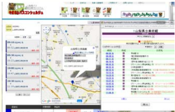
▲ やまなしバスコンシェルジュでの利用例