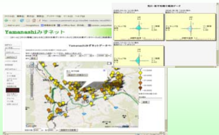
▲やまなし水ネット

山梨大学 社会連携・研究支援機構 Email: renkei-as@yamanashi.ac.jp Tel: 055-220-8759 Fax: 055-220-8757