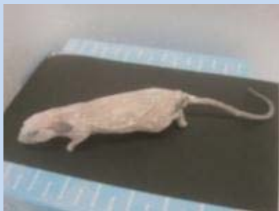
16年間-20℃で凍結保存されていたマウスの死体

たとえ脳や心臓に分化した細胞であっても、核内にはすべてのDNAが残っている。クローン動物は、この分化した体細胞の核を受精卵の状態に戻すこと(これを初期化と呼ぶ)によって生れてくるのだ。しかし初期化のメカニズムは不明であり、クローン動物の成功率はわずか1-2%しかない。本研究室では、その成功率を改善することを目指し、マイクロマニピュレーターという超微細顕微操作装置で毎日核移植を行っている。