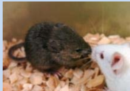
核が壊れていなければ死体からでもクローンマウスを作り出すことができる