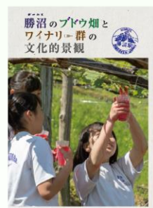
印刷媒体を用いた発信 (甲州市教育委員会との共同研究成果)

目的等をふまえて 最適な方法で、 地域の固有価値を発信します [固有価値が付加価値に]