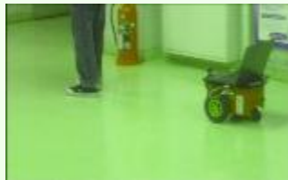
◆移動ロボットの人物追跡

カメラから画像情報をもとに移動ロボットの自律制御を実現しています。必要なセンサはカメラのみですので、システムの構成が簡単になります。