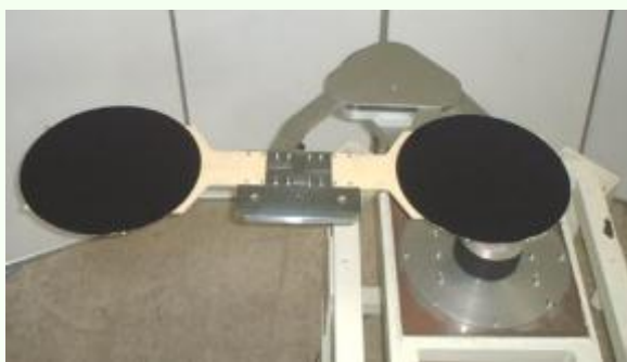
◆ウエハ搬送ロボット