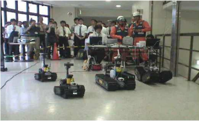
◆複数台レスキューロボットを使った想定訓練 【SICE2008(電気通信大学)にて】

地震などの災害時に被災者を発見したり、救助することを目的としたレスキューロボットの制御についての研究を行っています。