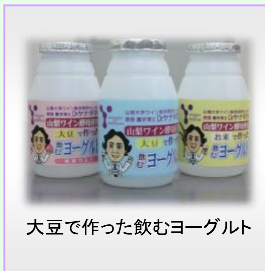
大豆で作った飲むヨーグルト

この開発のように、ワイン酵母を他の飲料に応用することによって新たな価値を生み出せる可能性があり、ワイン酵母の様々な利用方法について研究しています。